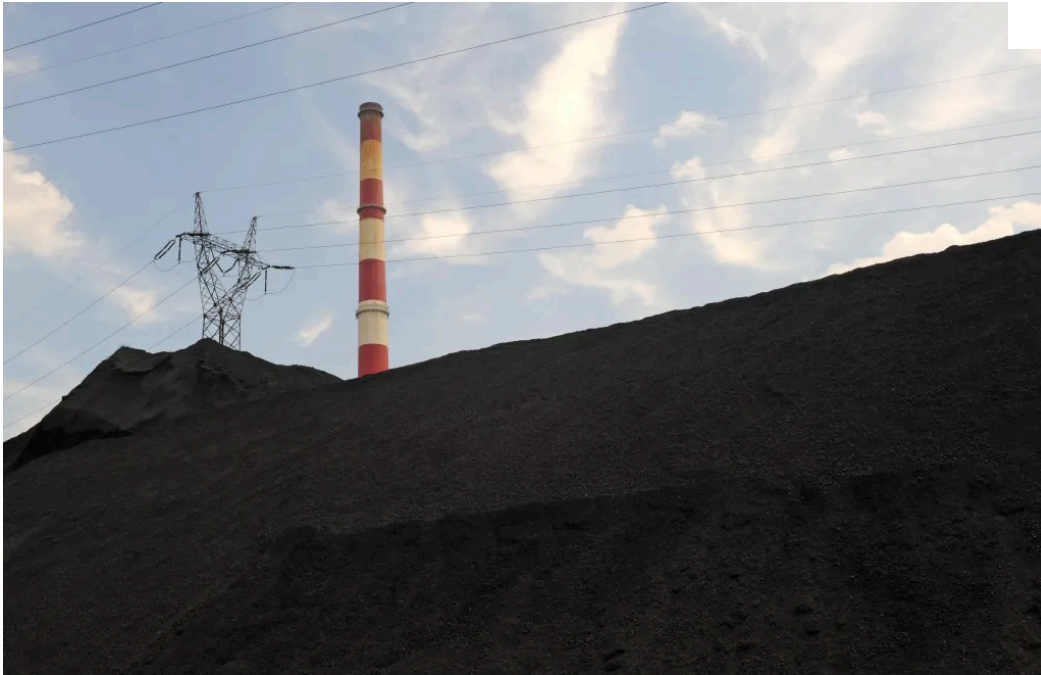
Illustrative photo Fig.

Opening the mining panel, crowning the 18th ECG on Friday, Prof. Krzemień put forward the thesis that Europe cannot talk about reindustrialization without raw materials. - And when we talk about raw materials, we talk about mining. We should redefine mining within the framework of a democratic, environmentally demanding, strategically responsible and conscious industrial policy," the expert said.